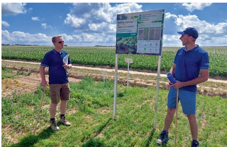
De uitbreiding van de Revysol-middelen voor aardappelen en bieten kreeg aandacht op het demoplatform van BASF

De Revysol-middelen behoren tot een nieuwe generatie triazolen die door de specifieke haakvorm van de moleculen sneller en beter hechten op moeilijke schimmelstammen. Ze zijn weinig onderhevig aan veel neerslag of aan UV-straling (fel zonlicht). Revysol is een handelsnaam van BASF voor de werkzame stof mefentrifluconazool, waar diverse handelsnamen onder vallen.